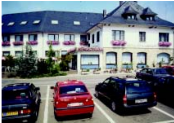
Außenansicht des Hotel Pip-Margraff, St. Vith, Belgien